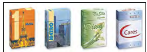
Zunächst vier Geschmacksrichtungen geplant

Ob die NicStic am Markt eine Chance hat, hängt sehr stark vom Preis ab. Der liegt jedoch für Außenstehende noch völlig im Dunkeln. Aber bald soll auch dieses Geheimnis gelüftet werden.