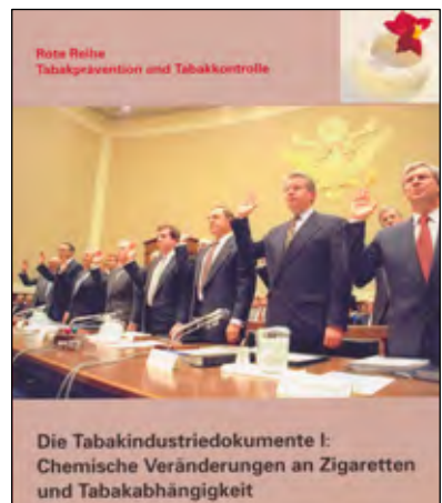
US-Tabakbosse beim Meineid

dkfz – WHO-CC Im Neuenheimer Feld 280 69120 Heidelberg ☎ 06221 423020 who-cc@dkfz.de